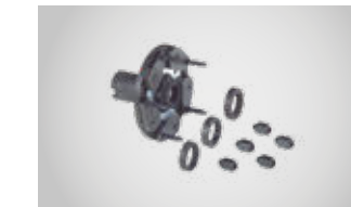
PN: 1695 654 043 Flangia a 3-4-5 fori completa di anelli di centraggio