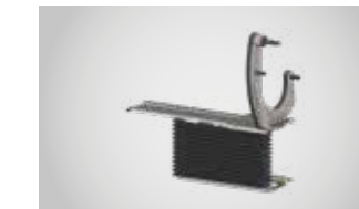
PN: 1695 601 012 Sollevatore pneumatici