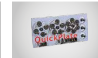
PN: 1695 655 294 Set di piattini rapidi (piattini con 4-,5-,6- buchi)