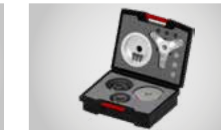
PN: 1695 656 569 Kit demo box per autocarri