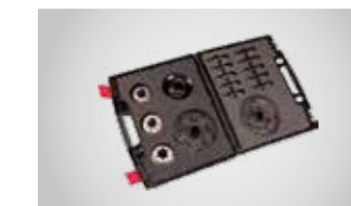
PN: 1695 656 570 Kit demobox vettura