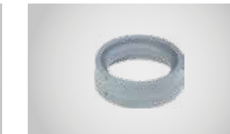
PN: 1695 606 200 Anello distanziatore