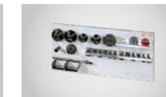
PN: 1695 654 060 Kit base per moto monobraccio-albero 19mm