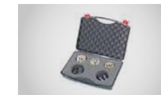
PN: 1695 656 698 Kit sistema di montaggio DuoExpert (54-78 mm)