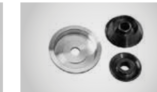
PN: 1695 654 849 Set di coni per trasporto leggero 88-174 mm