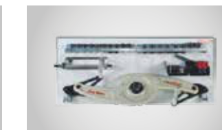
PN: 1695 654 039 Flangia moto (14mm)