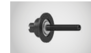
PN: 1695 601 011 Flangia Lunga (240 mm)