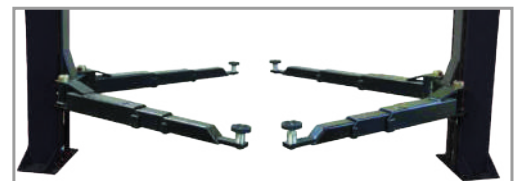
Arresto bracci a inserimento automatico e sgancio automatico da terra