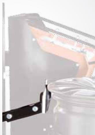
Utensile di montaggio tallone inferiore